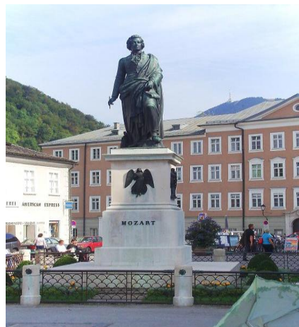
Памятник Моцарту в Зальцбурге, на родине композитора