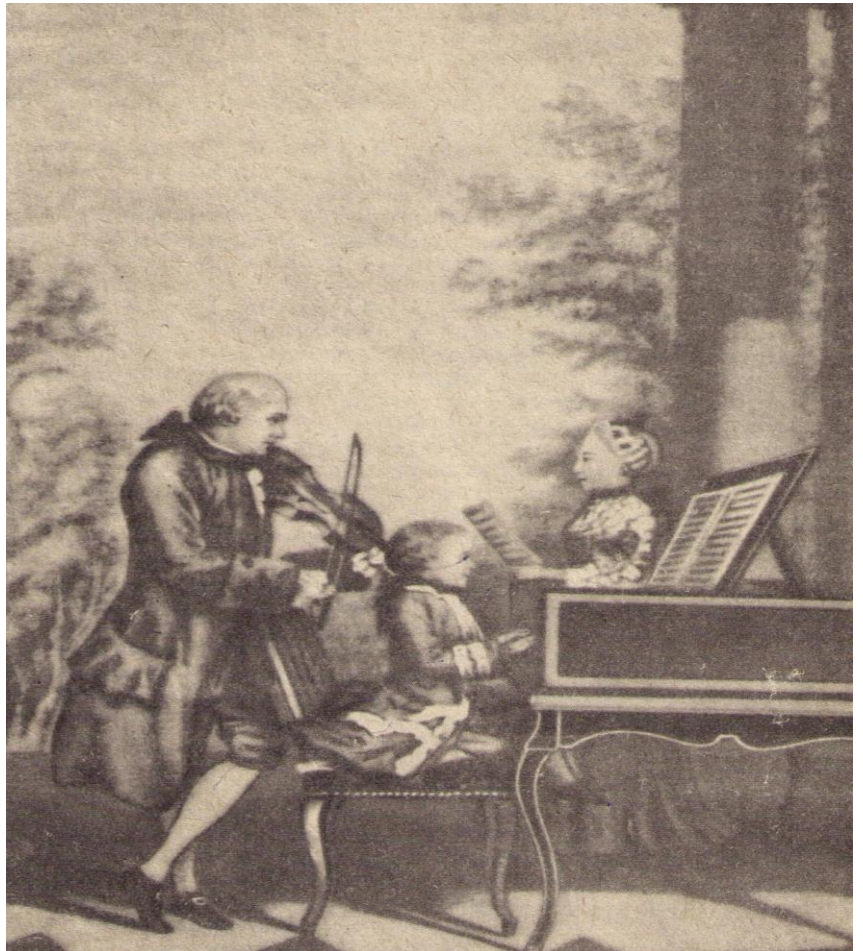
Семилетний Моцарт с отцом и сестрой Анной-Марией на концерте в Париже (1763)

Семья Моцартов отправилась в свое первое концертное турне, длившееся почти три года. Они посетили Мюнхен, Вену, Париж, Лондон, Амстердам, Гаагу, Женеву. Концерты маленького Моцарта его сестры Анны-Марии проходили с триумфальным успехом.