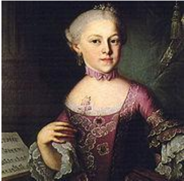
Анна-Мария Моцарт, старшая сестра Вольфганга Амадея

Семья Моцартов отправилась в свое первое концертное турне, длившееся почти три года. Они посетили Мюнхен, Вену, Париж, Лондон, Амстердам, Гаагу, Женеву. Концерты маленького Моцарта его сестры Анны-Марии проходили с триумфальным успехом.