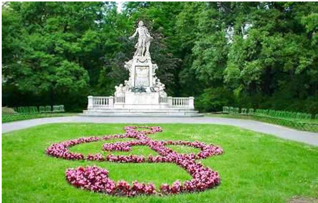
Памятник Моцарту в Вене

Произведение это стало лебединой песней Моцарта. Болезнь и смерть не дали завершить свое последнее творение. По записям композитора это сделал один из его учеников Ф. К. Зюсмайр. В этой гениальной музыке Моцарт раскрыл свою глубокую любовь к людям. И сегодня это одно из самых известных произведений.